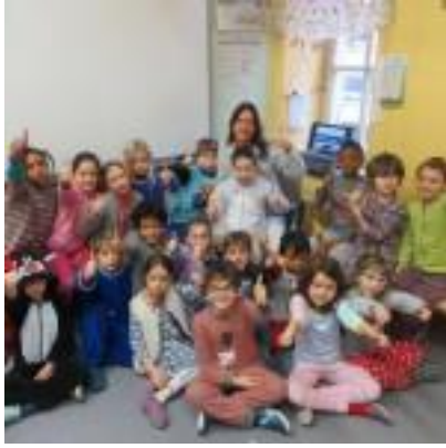
Pyjama-dag tweede leefgroep