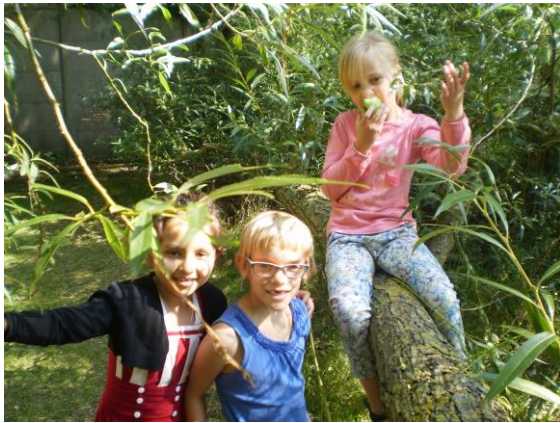
Boomklimmen Tweede leefgroep