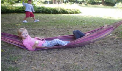
Hangmat op de grond Tweede Leefgroep