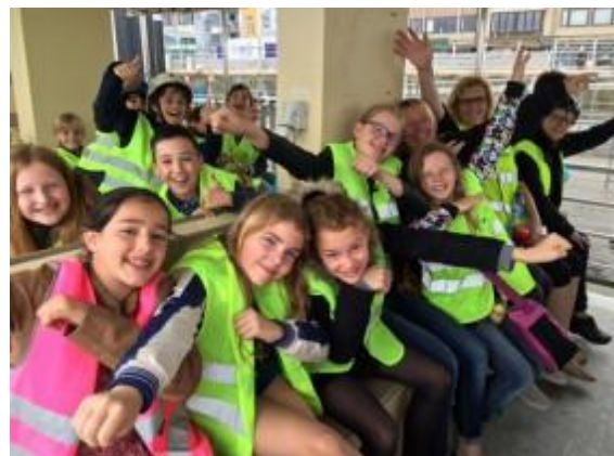
Fietstocht 4 de leefgroep